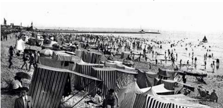
In 1936 wordt de wet op het betaald verlof goedgekeurd.

En dan wordt het oktober 1929. De beurs van Wall Street crasht. Europa voelt de gevolgen pas tegen het einde van 1930. En die zijn zwaar. Het Belgische sociaal-economische bestel gaat helemaal onderuit. Langs alle kanten breken stakingen uit. De crisis mondt in 1936 uit in de goedkeuring van twee belangrijke sociale wetten: de wet op het betaald verlof en die op de 40 urenweek in ongezonde en gevaarlijke ondernemingen.