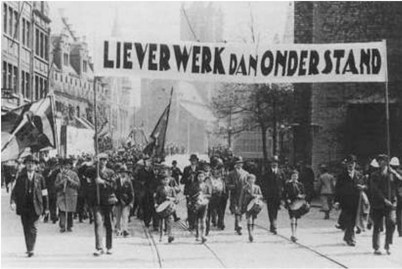
De economische moeilijkheden in het begin van de jaren 1930 joegen de werkloosheid de hoogte in. Rerum Novarum-viering van ACW-Gent in 1934.

Het interbellum introduceert het model van de eerste paritaire comités . Het zijn overlegorganen waarbinnen vertegenwoordigers van zowel de werknemers als de werkgevers het eens trachten te worden over een bepaald eisenpakket. Tussen 1919 en 1922 worden er 17 van die paritaire comités opgericht.