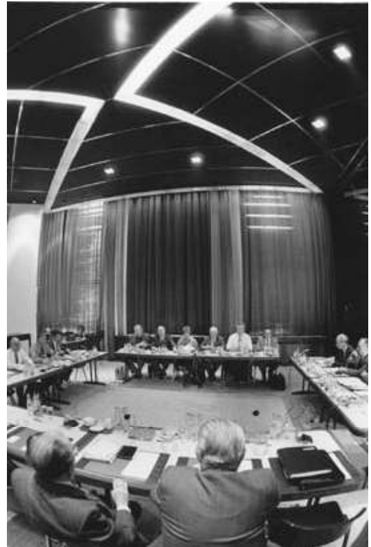
IPA-voorakkoord gesloten in de nacht van 11 op 12 september 1986.

De olieprijschok en de economische crisis van 1973 brengen het sociaal overleg in het slop: tussen 1976 en 1986 wordt er geen enkel IPA afgesloten .