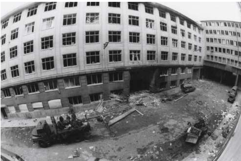
Voor het gebouw van het VBO ontploft in de nacht van 1 mei 1985 een bomauto.

We zijn er bijna. In 1973 smelten het VBN en het VBNIO (Verbond van de Belgische Niet-Industriële Ondernemingen) samen tot het Verbond van Belgische Ondernemingen (VBO) zoals we dat vandaag kennen. Voor de nieuwe organisatie gaat het er in de eerste plaats om "de vrijheid, het recht en de plicht om te ondernemen te bevestigen, die de voornaamste roeping van de ondernemer zijn".